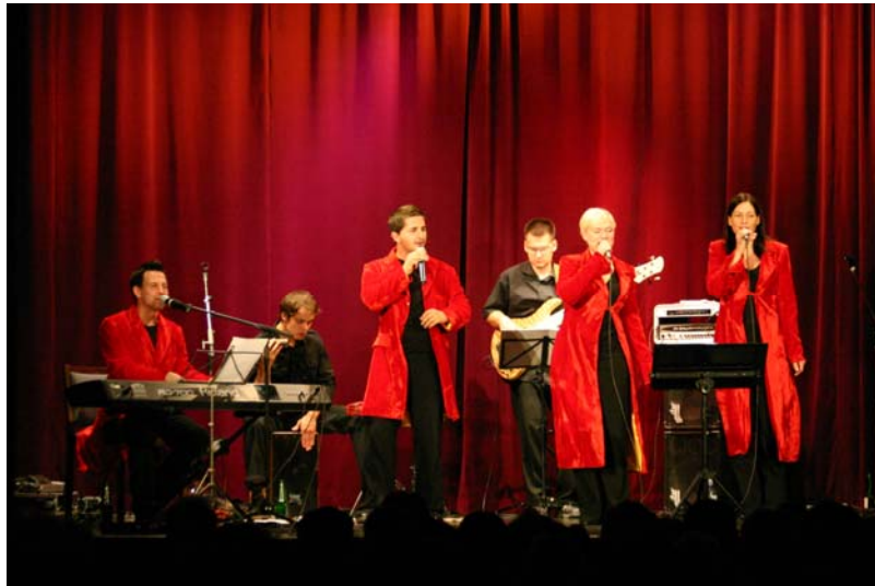
Bühnenmaße: mind. 6x4m exkl. Wings