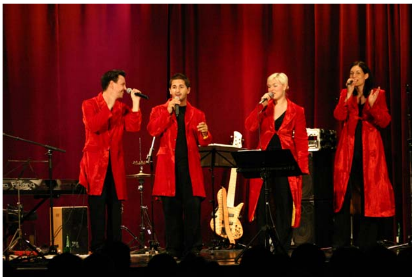
Bühnenmasse: mind. 6x3m exkl. Wings